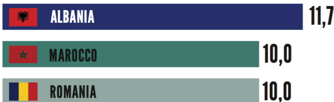
Primi tre Paesi di origine dei titolari di imprese individuali (%)

Sono donne il 25,0% dei titolari immigrati di imprese individuali attive in regione